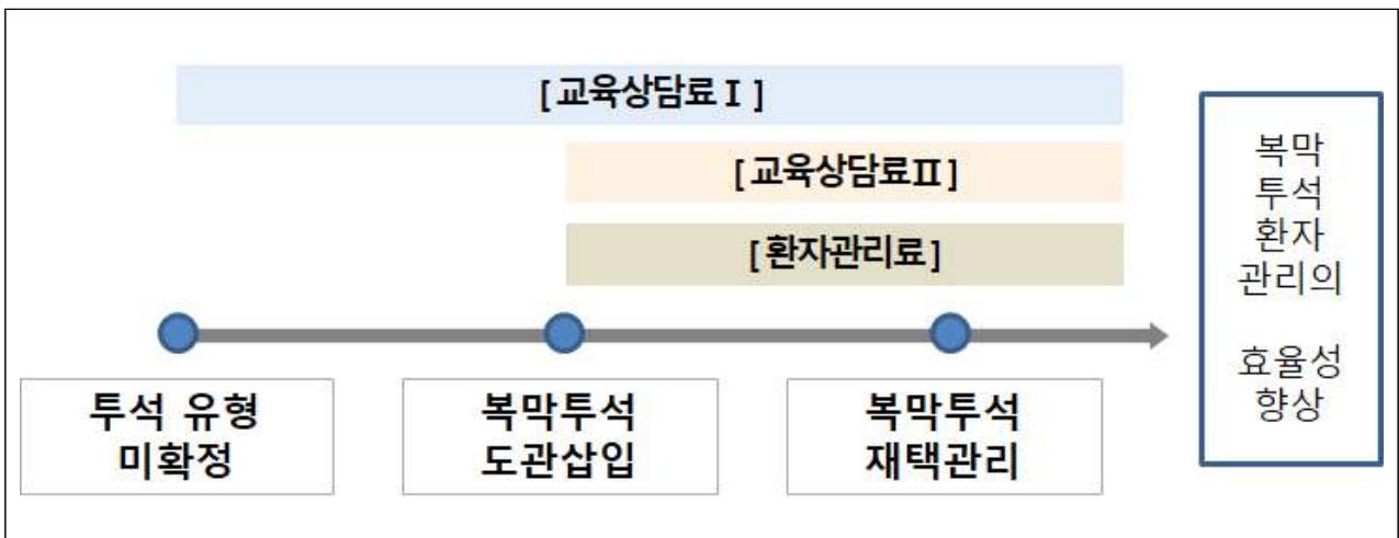
[그림] 복막투석 재택관리 시범사업 개념도